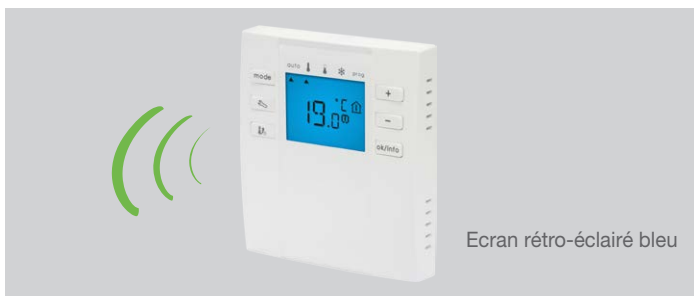
Ecran rétro-éclairé bleu